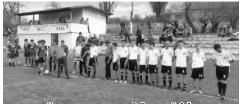
Матч между командами «Вайсал» и «Кубей»

главила местная команда. В Червоноармейском сильнее всех были футболисты Василевки. В этой группе они играли с командами