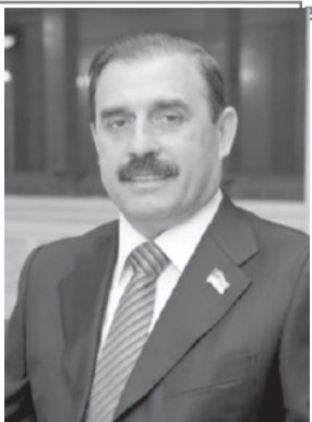
Антон КИССЕ, народный депутат Украины