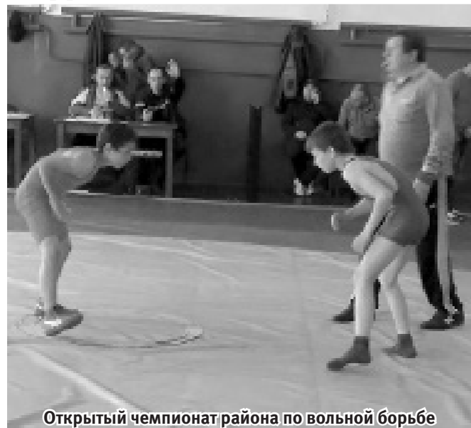
Открытый чемпионат района по вольной борьбе