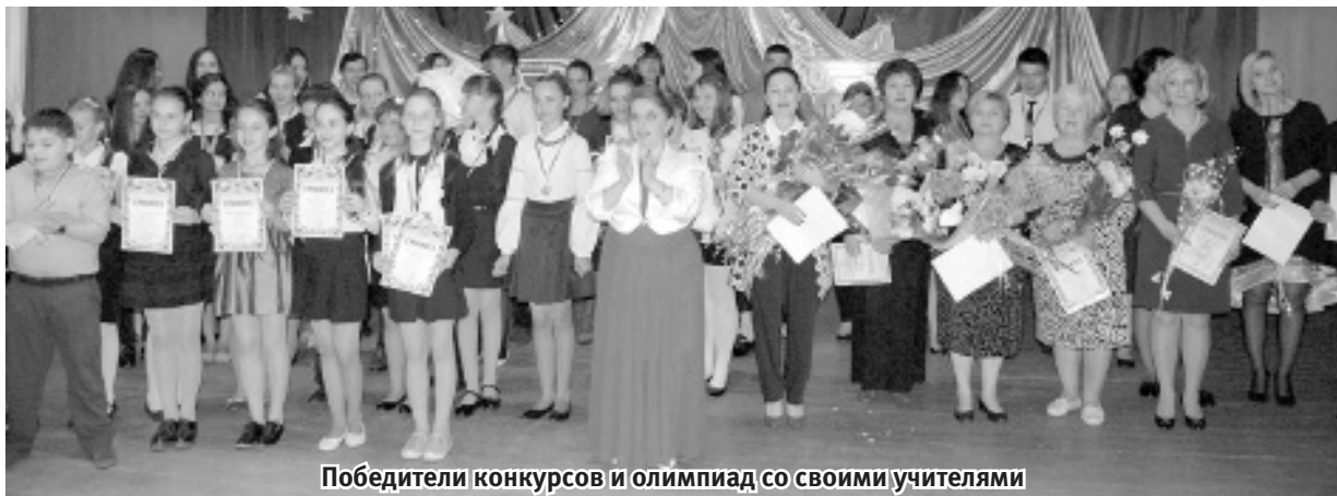
Победители конкурсов и олимпиад со своими учителями

и медалей в полной мере дает возможность понять, как традиции лицея помогают открыть и реализовать разнообразные способности учащихся, воспитывают веру в себя и свои возможности.