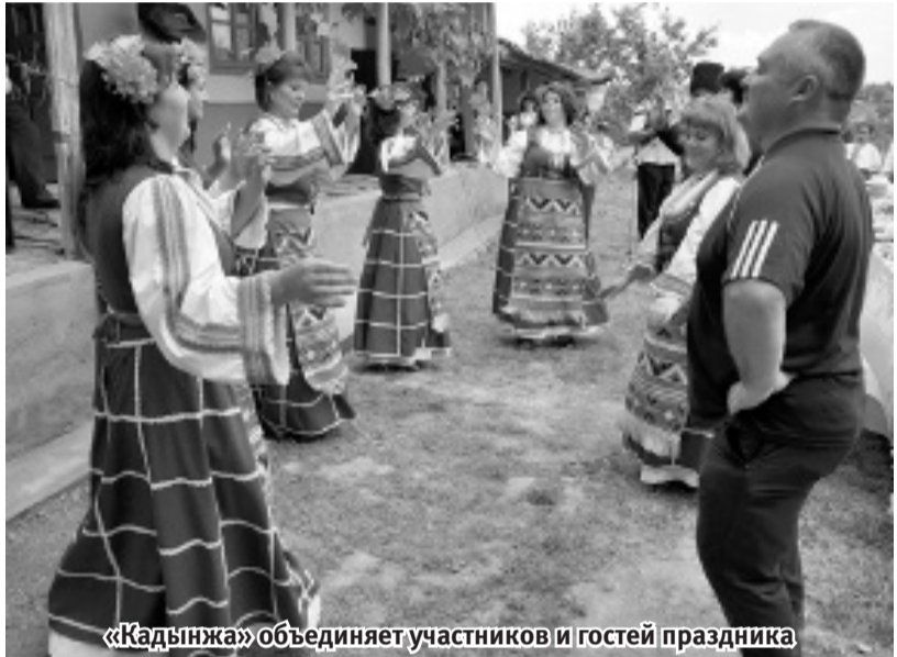
«Кадынжа» объединяет участников и гостей праздника

культуру нашего народа. Решили исправлять ситуацию. У меня по-