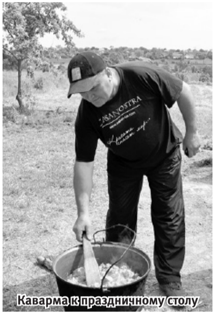
Каварма к праздничному столу