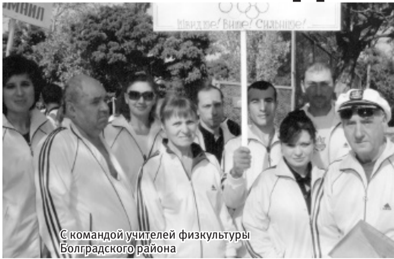
С командой учителей физкультуры Болградского района