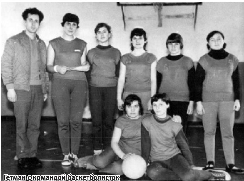
Гетман с командой баскетболисток