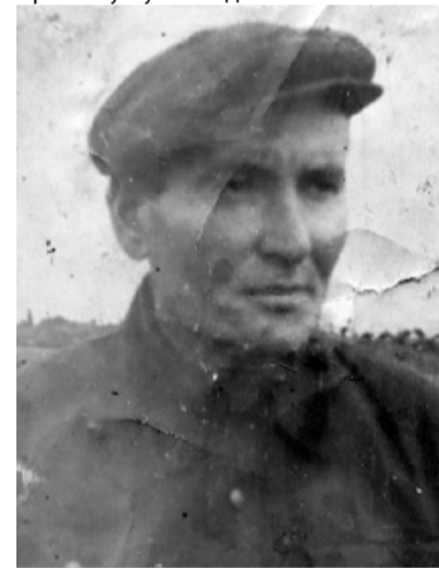
Это фото прислал дочерям отец из тюрьмы

отнесли на кладбище, уложив в общую могилу. К вечеру вернулся отец. Узнав о случившемся, он кинулся из дома. Оказалось, вернулся в контору и забрал лошадь. Он знал, что накажут, но столь сильно было желание спасти остальных, что, не задумываясь, он зарезал животное. Вскоре в дом ворвались четверо вооруженных милиционеров. Они связали отца, съели то, что он приготовил для семьи, забрали тушу лошади.