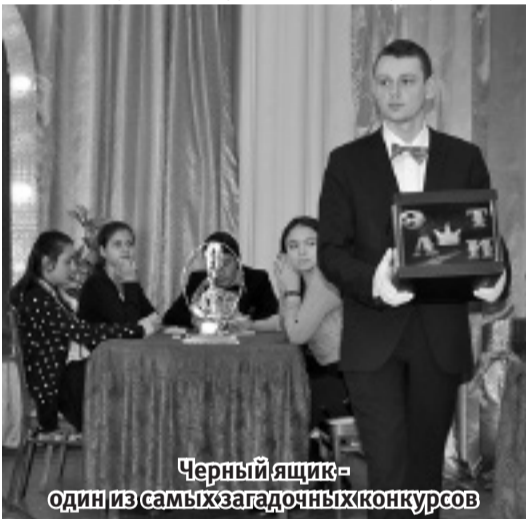
Черный ящик - один из самых загадочных конкурсов

После сложнейших раундов, в которых участники отвечали на вопросы крупье, отгадывали, что находится в черном ящике, победителями стала команда «Элит» Новотрояновского УВК. Второе и третье место разделили между собой команды «ЮМИР» Кубейской ОШ им. ак. А. Теодорова-Балана и «Эрудит» Кубейского УВК.