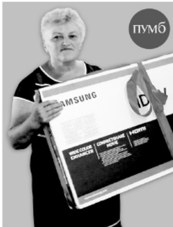
ПУМБ ПУМБ: Усі види банківських послуг. Банківська адреса: МБУ №8 від 06.18.2013р. Генеральна дирекція МБУ № 8-2 від 12.02.2018р. Адапція до в. 17.07.2017 до 10.09.2017 та продовження по об'єкт території Ізраїль (крім зона АТО та забороненої окупаційної території).

Оформити кредит в ПУМБ – легко і надійно, тим більше, що можна ще й виграти один з восьми телевізорів. Точка ПУМБу є і в нашому населеному пункті. Щоб дізнатися, де найближча – телефонуйте за номерами банку +38 050 41 78 788 або +38 098 29 08 788. Вартість дзвінків згідно тарифів вашого оператора.