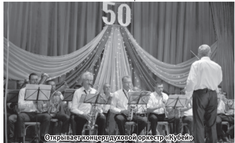
Открывает концерт духовой оркестр «Кубей»