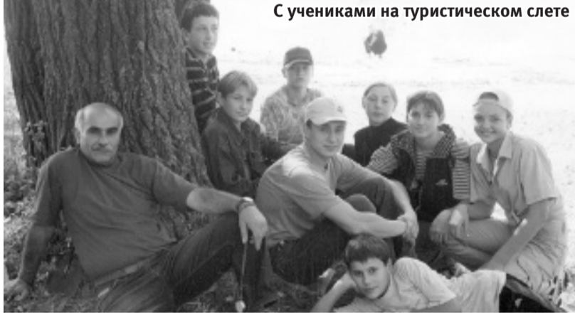
С учениками на туристическом слете