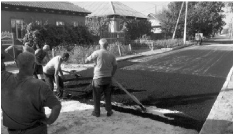
Силами жителей села и сельско-

го совета осуществляется капитальный ремонт двух пешеходных мостов над оврагом, соединяющих